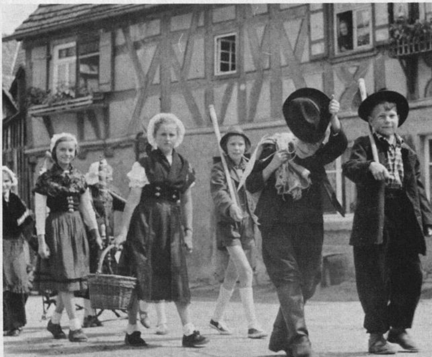
Lienzinger Kinder stellten beim Heimatfest 1958 die Einwanderung der Waldenser aus den Alpen und Südfrankreich dar.

Nach dem 2. Weltkrieg mußten zahlreiche Volksdeutsche in Böhmen und Mähren sowie Reichsdeutsche in Schlesien, Pommern, Westpreußen und Ostpreußen ihre Heimat verlassen und von Westdeutschland aufgenommen