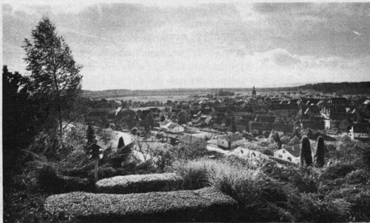
Blick von der Münch-Villa auf das Dorf Lienzingen

An die Arbeit und Mühe der Landleute, und das waren ja weitaus die meisten der alten Lienzinger, erinnert aus früherer Zeit noch der Name Grugstatt (Ruhstatt). An der Ecke des Katzenwaldes war beim ehemaligen Hopfenstück der Brauerei Schneider ein Holzgestell zum Ausruhen errichtet. Es bestand aus zwei starken eichenen Pfosten, über die ein paar Bretter quer gelegt waren. In geringer Höhe vom Boden waren die Pfosten ebenfalls mit einem eingelassenen Brett miteinander verbunden. Die Grugstatt diente besonders den kleinen Leuten, die kein Gespann hatten und alles mühevoll heimbringen mußten, zur Erleichterung ihrer Arbeit. Es waren vor allem die Frauen, die das Futter fürs Vieh in einem Grastuch auf dem Kopf heimtragen mußten und dabei ihren „Plunder“ auf dem oberen Brett abstellten und sich dann zum Ruhen auf das untere setzten. Die Grastücher waren hauptsächlich aus Bändern hergestellt. Einzelne sind noch in Lienzingen vorhanden.