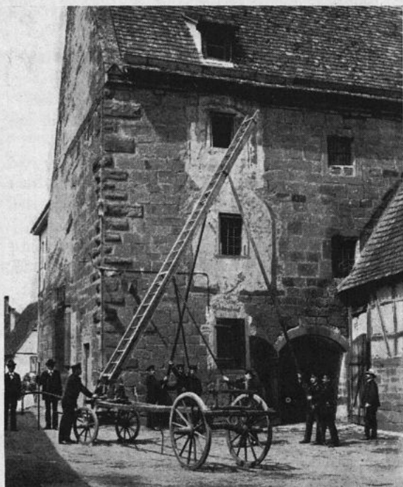
Die drehbare Schiebeleiter von Knittlingen (Aufnahme von 1912)