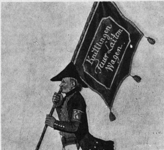
Der Obmann von der Leiter- abteilung der Knittlinger Feuerwehr ums Jahr 1810