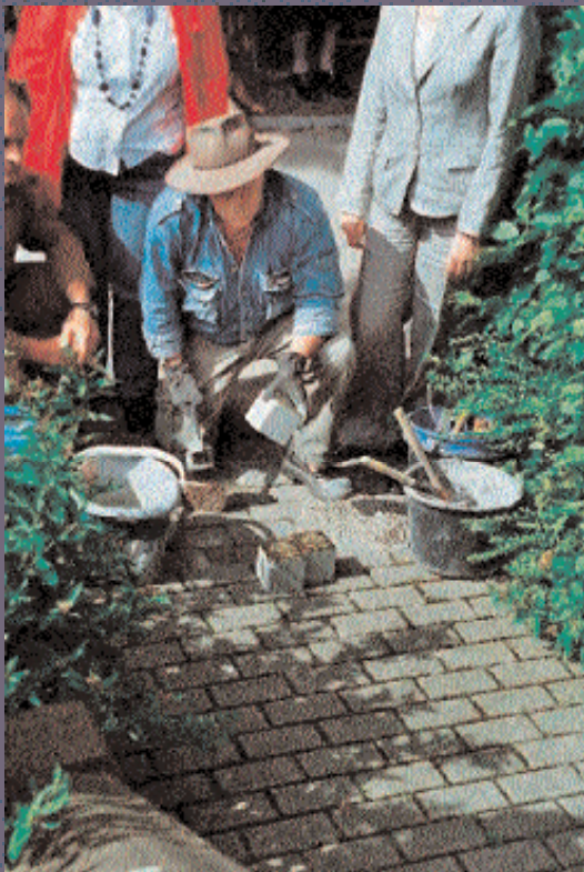
Gunter Demnig bei der Verlegung von Stolpersteinen in Mühlacker 2009

Interview: Stolpersteine - Idee, Vorgeschichte und Entwicklung eines Projektes