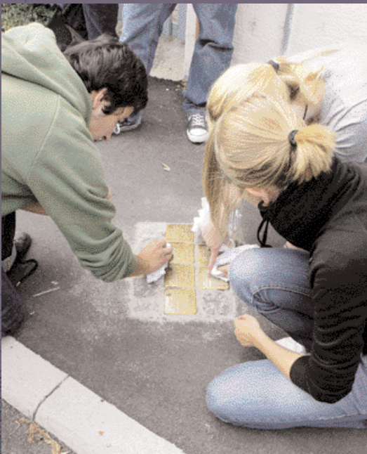
Schülerinnen und Schüler des THG beim Putzen und Polieren von Stolpersteinen