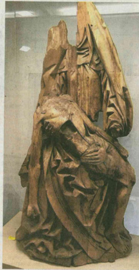
Pietà im Heimatmuseum.

Mehrere Schritte sind geplant. Zuerst soll eine wissenschaftliche Untersuchung des Originals im Rahmen einer Masterarbeit an der Kunstakademie erfolgen einschließlich Analyse der Schadstoffbelastung der Skulptur und einer Rekonstruktion der – soweit möglich – ursprünglichen Fassung. Zu den weiteren Schritten gehören schließlich die Auswertung etwaiger Quellen zur Skulptur sowie die Kopie und Rekonstruktion der Pietà durch Bildhauer Hildenbrand in Lindenholz und die Aufstellung der Replik in der Kirche. Dies soll Ende 2022 oder im Frühjahr 2023 geschehen. Das Original im Heimatmuseum wiederum soll dann „an einen leichter zugänglichen Ort“ umziehen.