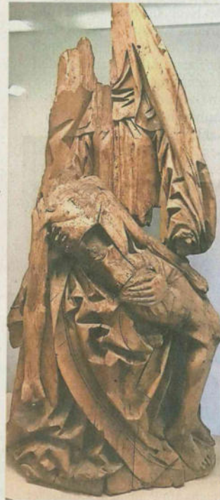
Die seltene Skulptur wurde Mitte der 1970er-Jahre aus der Frauenkirche in Lienzingen ins Mühlacker Heimatmuseum gebracht.

„Wir gehen davon aus, dass die Pieta aus dem 15. Jahrhundert stammt, können aber aktuell noch nicht sagen, wer sie angefertigt hat oder wie alt sie genau ist“, sagt Terp-Schunter. Klar ist dennoch: Die Figur sorgt bereits für Furore. Der Gemeinderat hat geradezu euphorisch reagiert, als klar war, dass Mühlacker einen kulturhistorischen Schatz in seinem Besitz hat, der nun mehr oder minder völlig neu entdeckt wird. Der Historisch-Archäologische Verein Mühlacker, der das rund