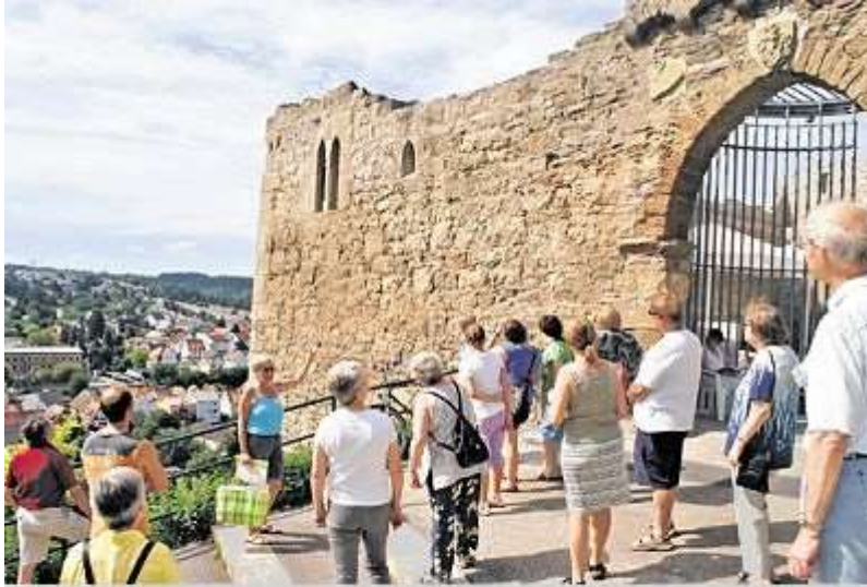
Gute Resonanz: Mehr als 20 Besucher nutzen die Möglichkeit, einen Blick hinter die Kulissen der Burgruine Löffelstelz zu werfen. Außerhalb der Besichtigungstermine ist das Tor verschlossen.

In früheren Jahrhunderten musste sich die Anlage gegen ungebetene Besucher zur Wehr setzen, doch seit ihrer Sanierung empfängt die Burgruine Löffelstelz hoch über Mühlacker gerne ihre Gäste. Das Interesse am Wahrzeichen der Stadt ist ungebrochen.