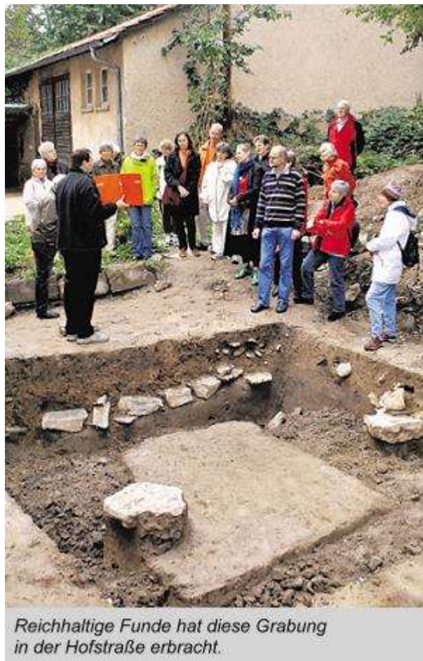
Reichhaltige Funde hat diese Grabung in der Hofstraße erbracht.