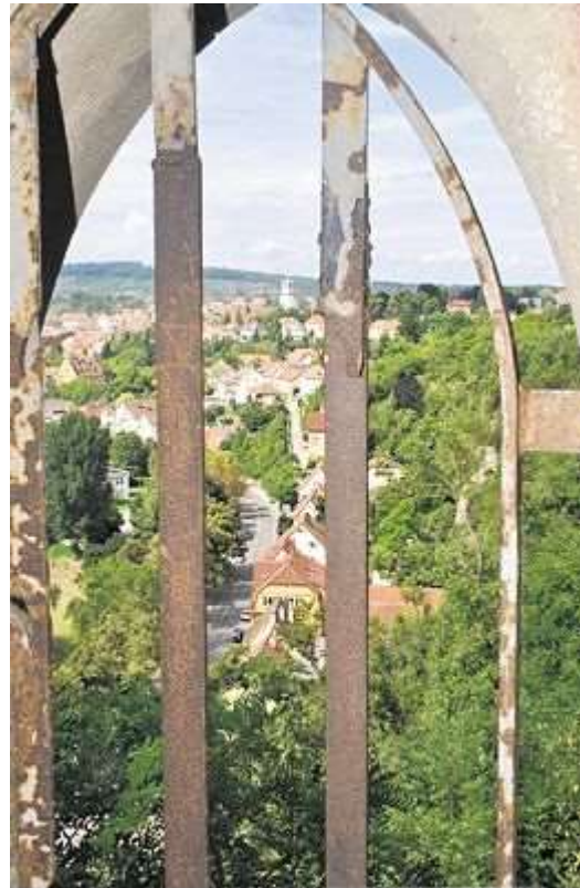
Tolle Aussicht inklusive: Blick von der Löffelstelz auf die Stadt Mühlacker

Bis zurück in das zehnte beziehungsweise elfte Jahrhundert reicht die Geschichte der Burg mit dem im Volksmund doch eher ungewöhnlichen Namen Löffelstelz. Woher der stammt? Sonngard Bodner kennt auch die dazu passende Episode. Früher, so erzählt sie, sei die Enzstraße ein eigenständiges Dorf gewesen. Weil sich die Ortschaft aber an der Enz entlang zog, hätten sie die Menschen im Mittelalter mit dem Spitznamen Löffelstiel bedacht - und da war es bis zur Löffelstelz nicht mehr weit.