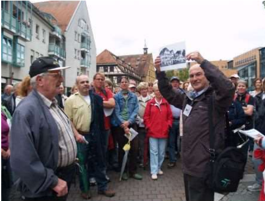
Faszinierende und spannende Rückblicke in die Stadtgeschichte: Der Rundgang, der alte Wegverbindungen der Stadt in den Mittelpunkt stellt, stößt auf ein reges Interesse.

Wissen unters Volk. "Gängele und Stäffele" standen bei der jüngsten Führung auf dem Programm.